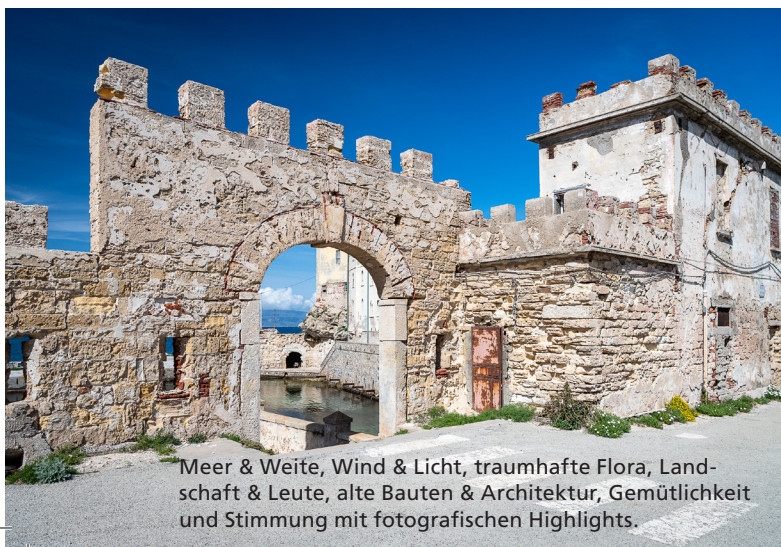
Meer & Weite, Wind & Licht, traumhafte Flora, Landschaft & Leute, alte Bauten & Architektur, Gemütlichkeit und Stimmung mit fotografischen Highlights.